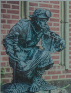
St. Jakobus-Pilger vor der St. Antonius-Kirche, 81302040 - 100 - 100000

Kevelaer liegt am Jakobsweg 3, welcher zwischen Rhein und Maas von Millingen in den Niederlanden bis nach Roermond führt.