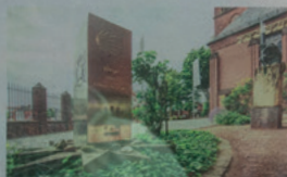
Stelle an der St. Antonius-Kirche, 81302040 - 100 - 100000

Der Jakobsweg ist wahrscheinlich der bekannteste Pilgerweg unserer Zeit. Seit tausend Jahren wandern auf ihm Pilger zum Grab des Apostels Jakobus im spanischen Santiago de Compostela. Dies ist die berühmteste Etappe des Weges. Bei dem Jakobsweg handelt es sich eigentlich um eine Ansammlung vieler Wege, die nach Santiago de Compostela führen. Erkennungszeichen aller Jakobswege ist die Pilger- oder Jakobsmuschel. Sie dient auch zur Beschilderung und ist in allerlei Variationen am Wegesrand zu finden.